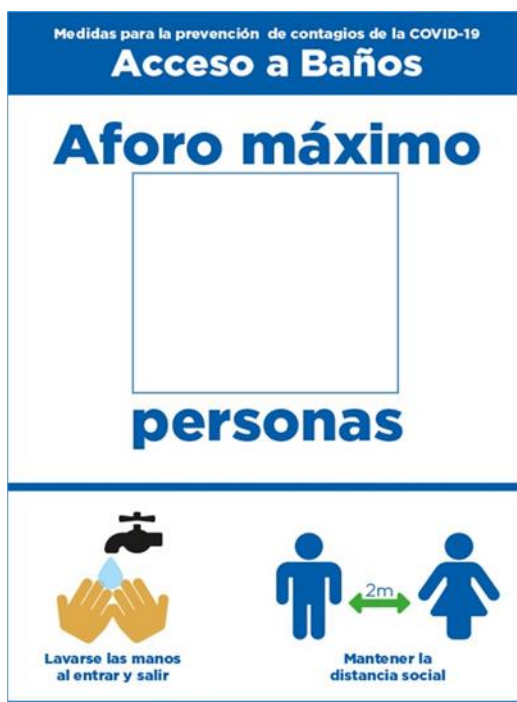
Ejemplo de señalética indicando aforo máximo permitido