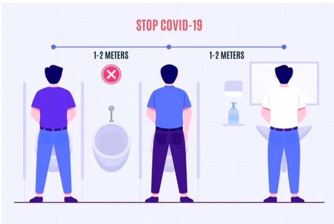
Ejemplo de prácticas para asegurar distanciamiento físico en urinarios