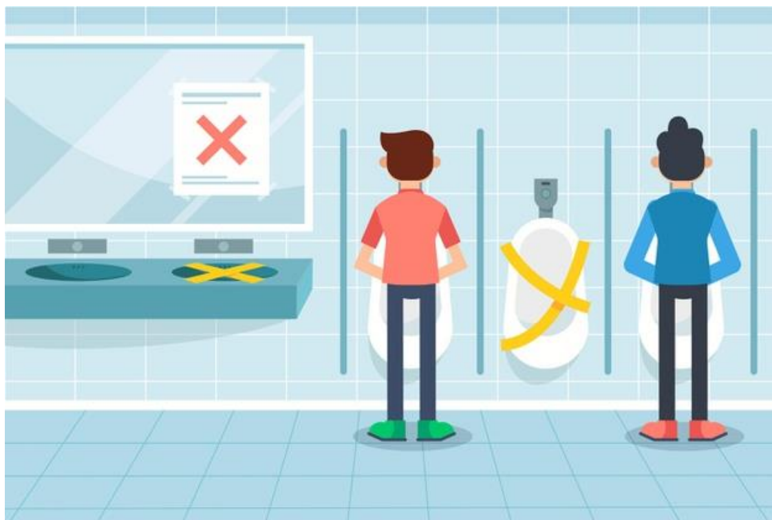
Ejemplo de prácticas para asegurar distanciamiento físico en urinario